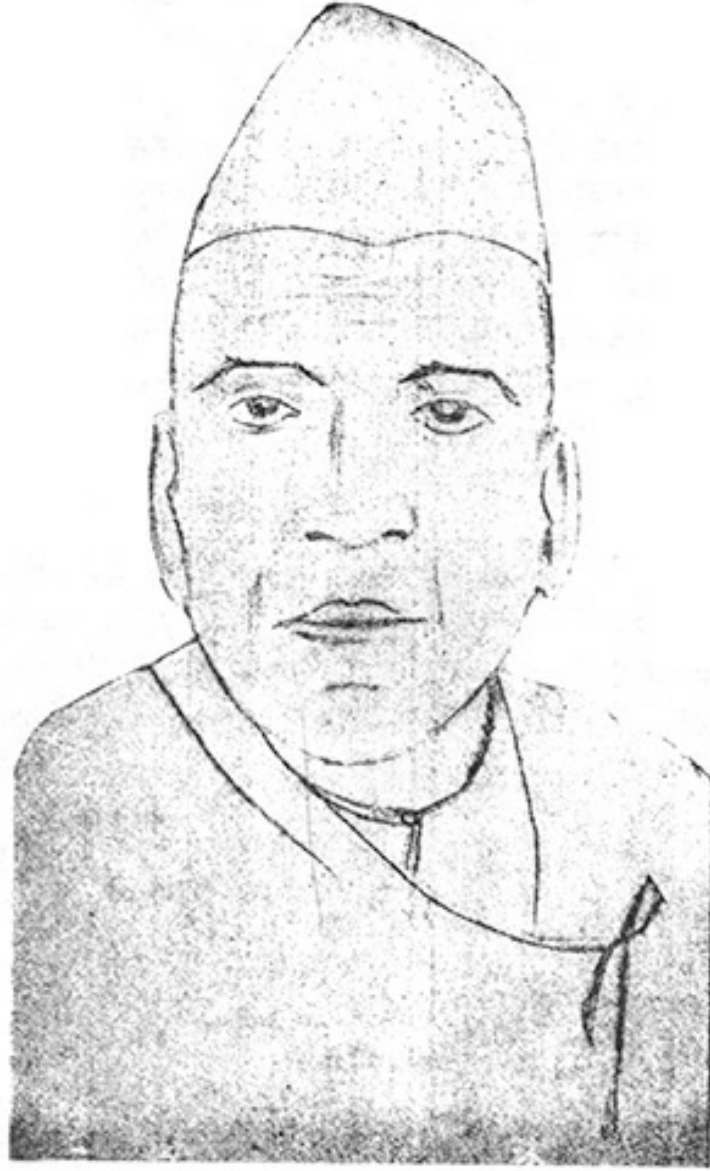
स्व० मैथिलीशरण गुप्त जन्म—सन् १८८६ ई० निधन—सन् १९६४ ई०