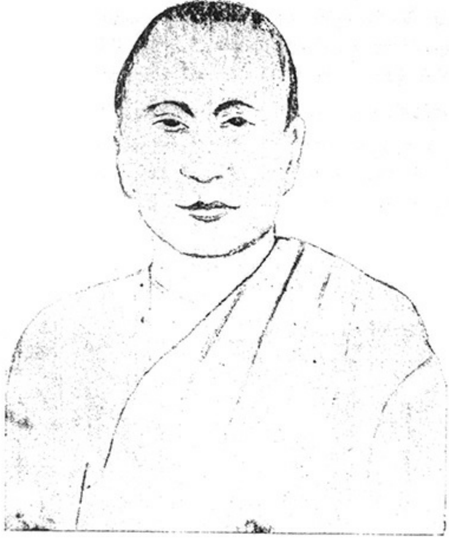
स्व० जयशंकर 'प्रसाद' जन्म--सन् १८८६ ई० निधन--सन् १९३७ ई०