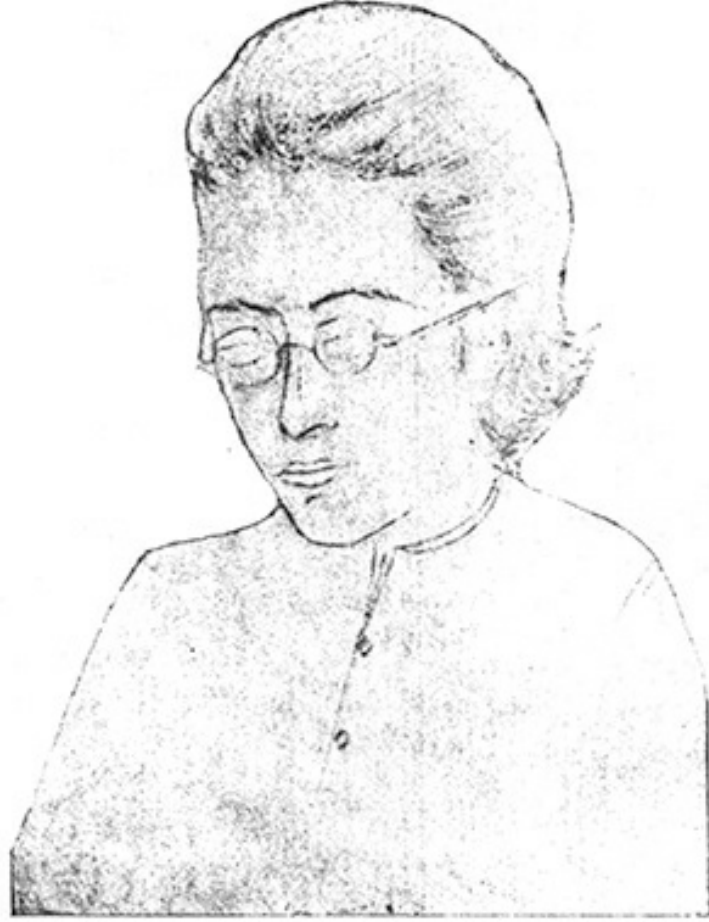
स्व० सियारामशरण गुप्त जन्म—सन् १८६५ ई० निधन—सन् १९६३ ई०