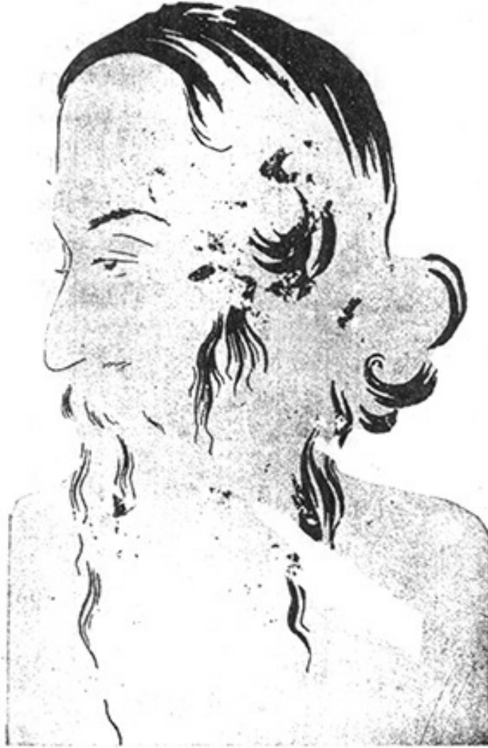
स्व० कवीन्द्र रवीन्द्रनाथ ठाकुर जन्म—सन् १८६१ ई० निधन—सन् १९४१ ई०

कवीन्द्र रवीन्द्रनाथ ठाकुर जी की हस्तलिपि