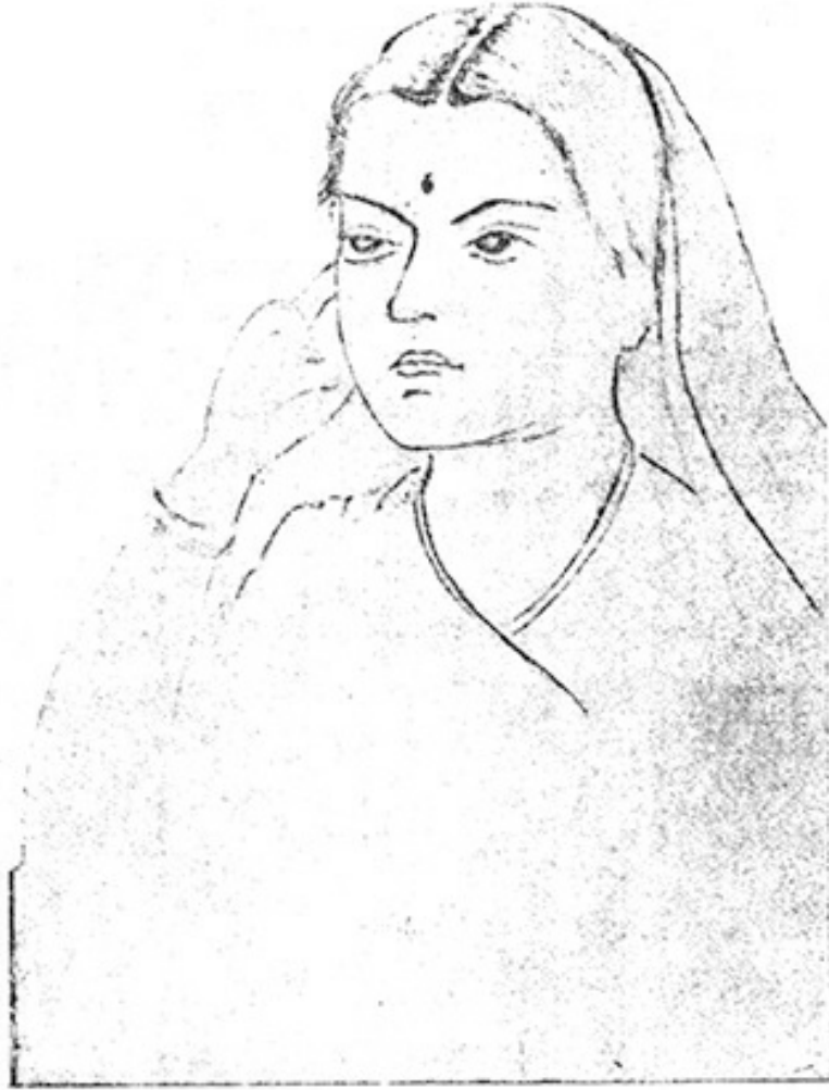
स्व० सुभद्राकुमारी चौहान जन्म—सन् १९०४ ई० निधन—सन् १९४८ ई०